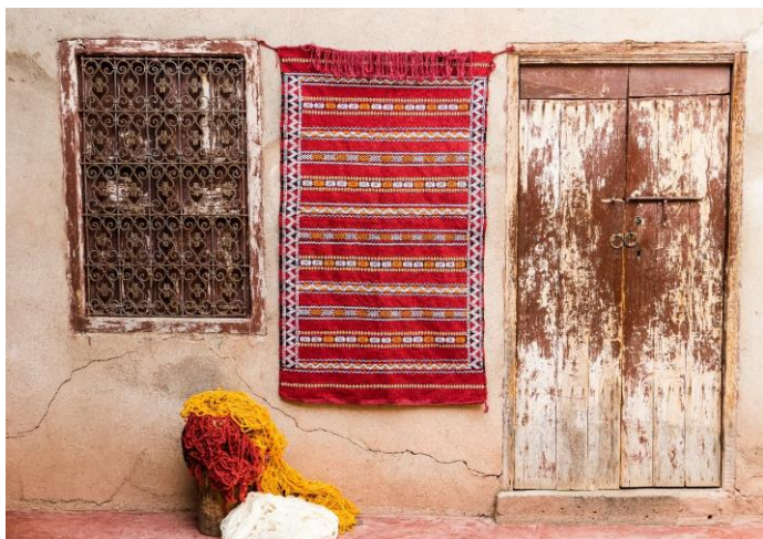
Tapis produit par les femmes membres de la coopérative Fadl Tighedouine - projet d'autonomisation des femmes à travers l'entrepreneuriat durable

Une belle histoire de persévérance et de détermination qui a assuré une autonomisation économique aux femmes du village et ses environs via une production respectueuse de l'environnement.