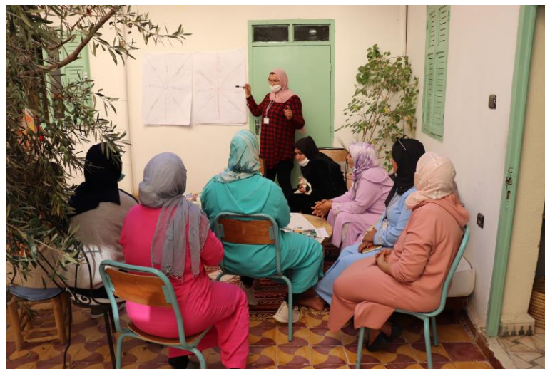
Séance de partage de connaissances entre des coopératives des différents projets des provinces d'El Haouz et Sidi Slimane.

De nouvelles visites sont prévues en 2022, qui devraient leur permettre de discuter des différentes étapes de développement.