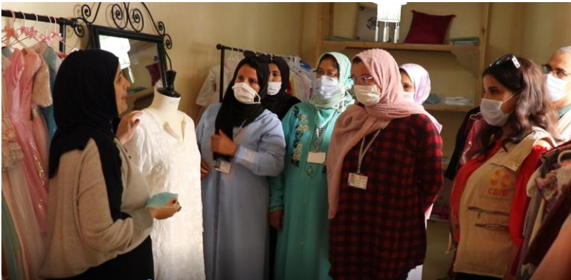
Présidente de la coopérative Alwane expliquant le processus aux participantes du projet d'autonomisation économique et sociale des femmes cueilleuses de fleurs d'oranger - coopératives Khoyout Al Amal et Nassij Al Hassnaoui à Dar Bel Amri dans la province de Sidi Slimane

Un voyage d'échange entre deux projets d'intérêt commun: l'autonomisation des femmes rurales. Cette visite a été organisée durant le mois de novembre 2021 dans la région de Marrakech-Safi, à l'intention des représentantes des différentes coopératives de la province de Sidi Slimane.