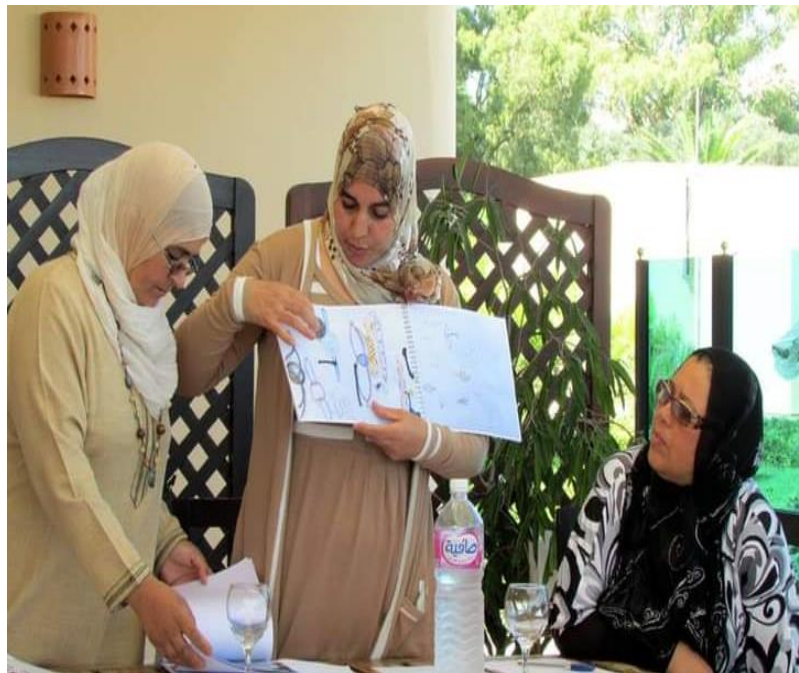
Les membres de la coopérative Angouane lors d'une séance de travail

Cette opportunité va permettre de générer un revenu de plus pour les femmes et donner une chance aux jeunes filles de la région d'intégrer la coopérative dans le cadre du programme « Progression professionnelle des filles ».